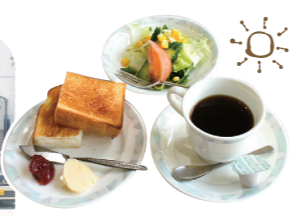
当店人気のモーニングセット

丸中本店 松阪市中町 1843-6 営業 8:00~18:00 休 日曜 TEL 0598-21-1121 URL https://www.marunakaniku.com