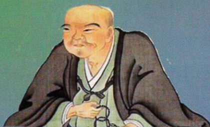
みついたかとし 三井高利 1622～1694