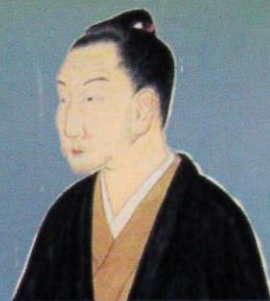
もとおりのりなが 本居宣長 1730～1801