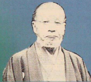
はらだじろう 原田二郎 1849～1930