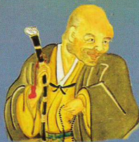
おおよどみちかぜ 大淀三千風 1639～1707