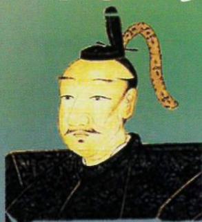
がもうじさと 蒲生氏郷 1556～1595