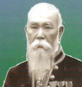
おおたにかへえ 大谷嘉兵衛 1844～1933