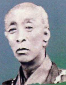
まつらたけしろう 松浦武四郎 1818～1888