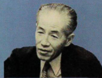
とうばせいいち 東畑精一 1899～1983

主催 松阪偉人顕彰団体協議会 共催 松阪市 後援 松阪市教育委員会 協賛 公益財団法人原田積善会・公益財団法人岡田文化財団