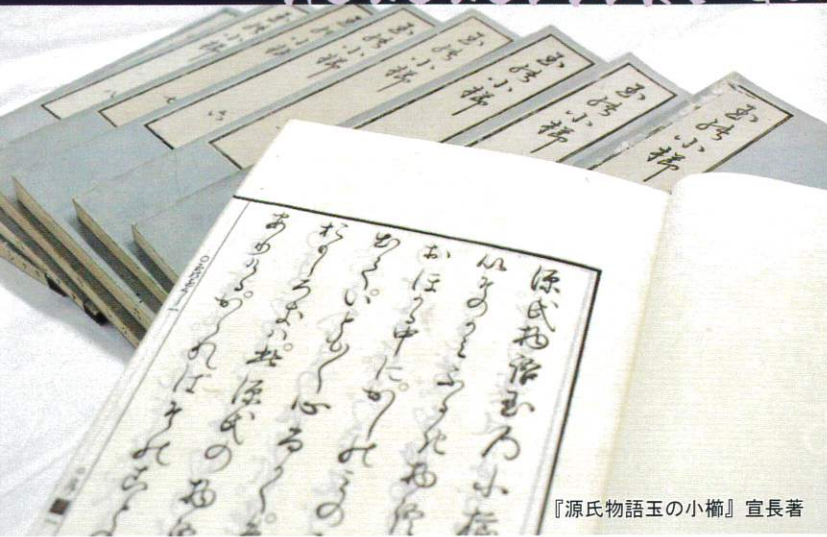
『源氏物語玉の小櫛』 宣長著